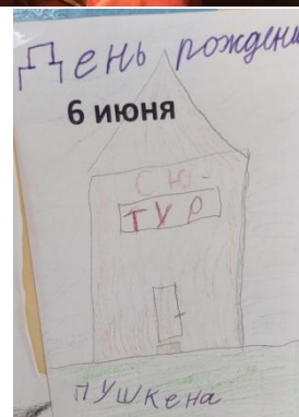
Лист из «Ленты событий» 1 отряд